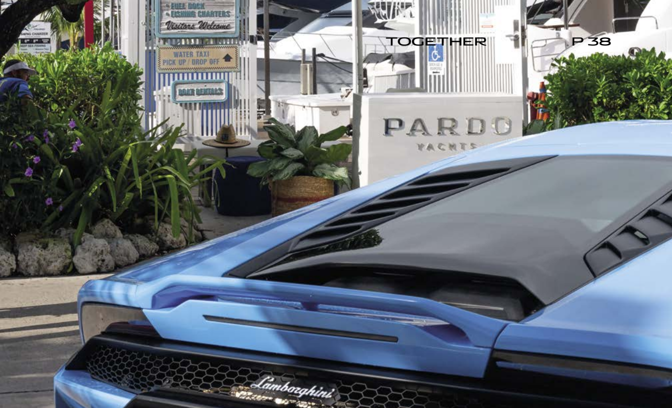
MIAMI - PARDO YACHTS & LAMBORGHINI